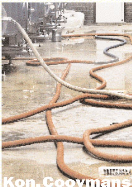
Kon. Cooymans Tilburg