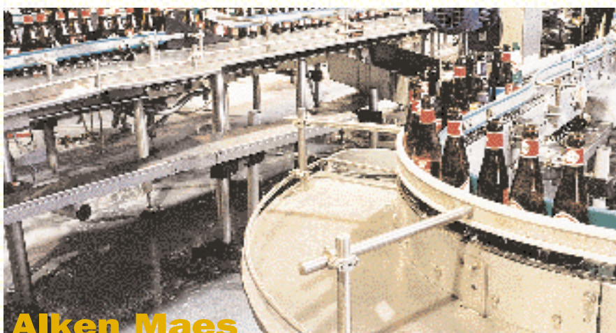
Alken Maes Alken